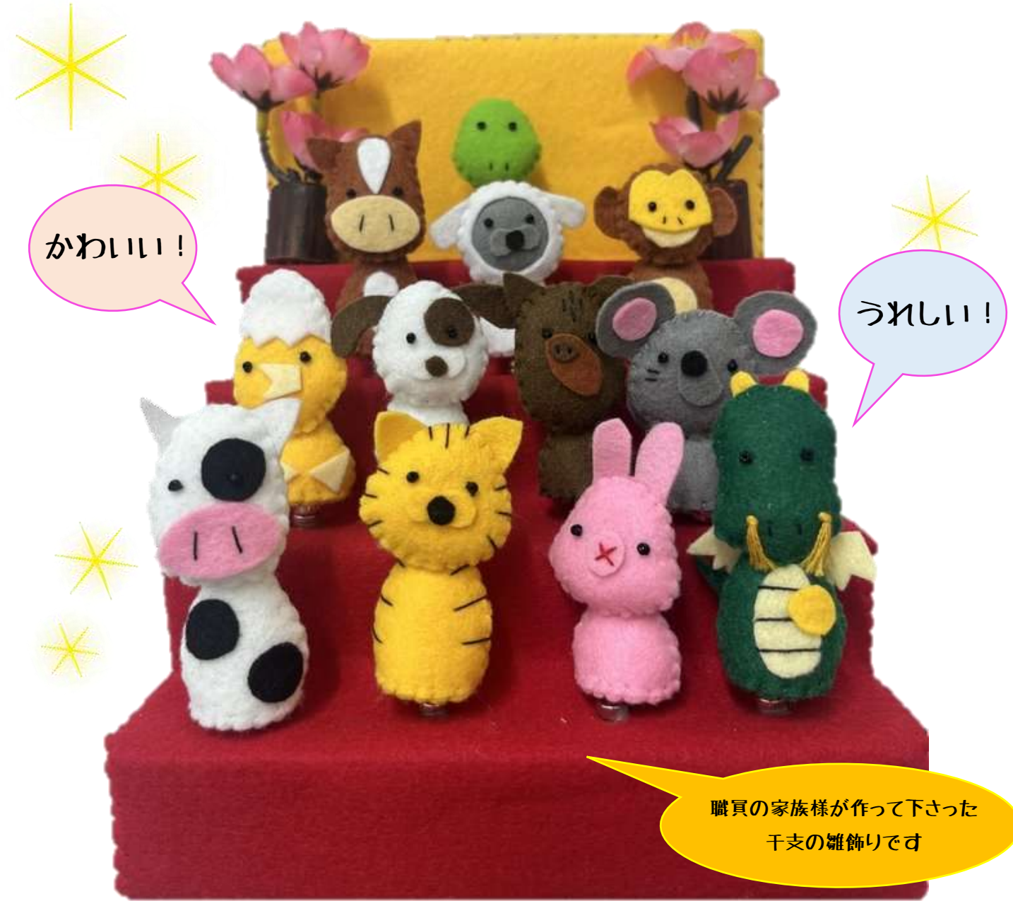
職員の家族様が作って下さった 干支の雛飾りです