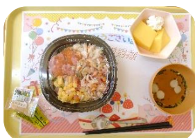
刻み食の方用ちらし寿司