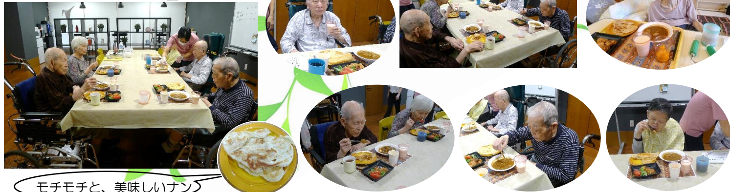
モチモチと、美味しいナン