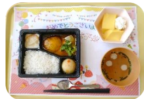
とても柔らかいチーズハンバーグ弁当

7月のお誕生日会は、コロナ感染の為、皆で集まって…は中止し、各フロアいつもの食席で誕生日会恒例の握り寿司を食べていただきました。