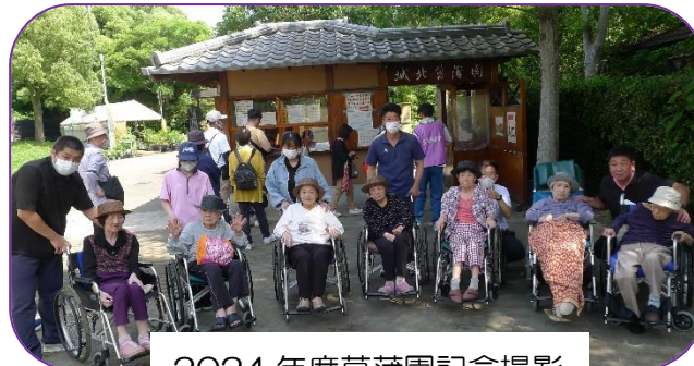
2024年度菖蒲園記念撮影