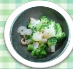
エビとブロッコリーのサラダ