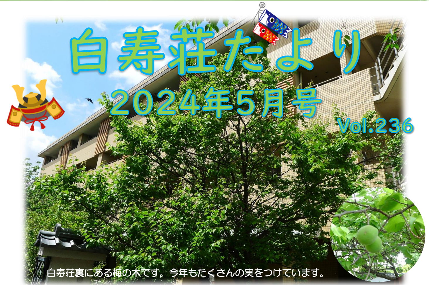
白寿荘裏にある梅の木です。今年もたくさんの実をつけています。