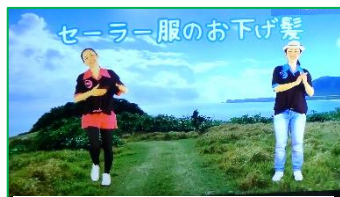
皆さまが見ておられる テレビ画面です