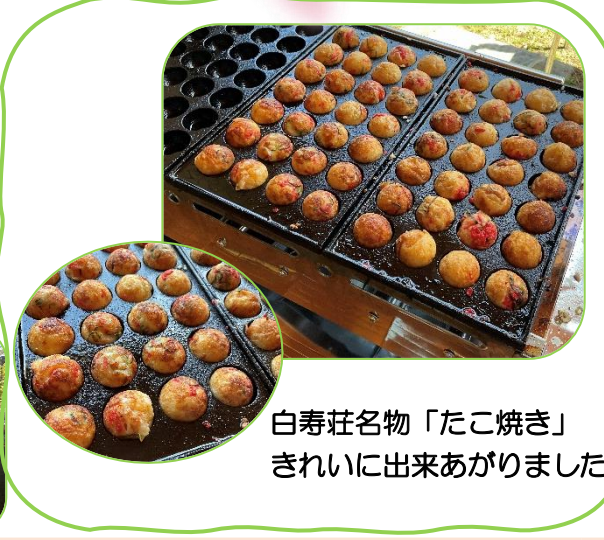
白寿荘名物「たこ焼き」 きれいに出来あがりました