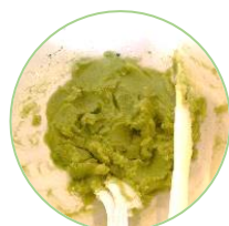
サツマイモ抹茶餡