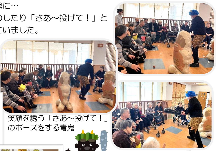
笑顔を誘う「さあ～投げて！」のポーズをする青鬼

青鬼、赤鬼と一緒に「ハイ、ポーズ」笑顔の写真は記念にラミネート加工を施しお部屋に飾っています。