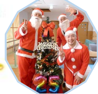
白寿荘おじさんサンタ

2023年12月25日白寿荘おじさんサンタが、ケーキとプレゼントを持って入居者の皆さんのところを周りました。 可愛いカップに入ったティラミスケーキにおやつイチゴとチョコのプチケーキ。 甘いもの好きの入居者様はニコニコ顔で記念撮影をしています。