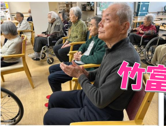
竹富島で会いましょう

3月29日に寿寿に「美らコイ」という二人組のユニットが三線ライブをしに来てくれました！最初は皆様に雰囲気をお伝えしてくれるために今日お誕生日の方向けに「ハッピーバースデー」と童謡の「ふるさと」を披露してくれました。