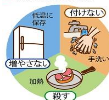
■食中毒予防の3原則