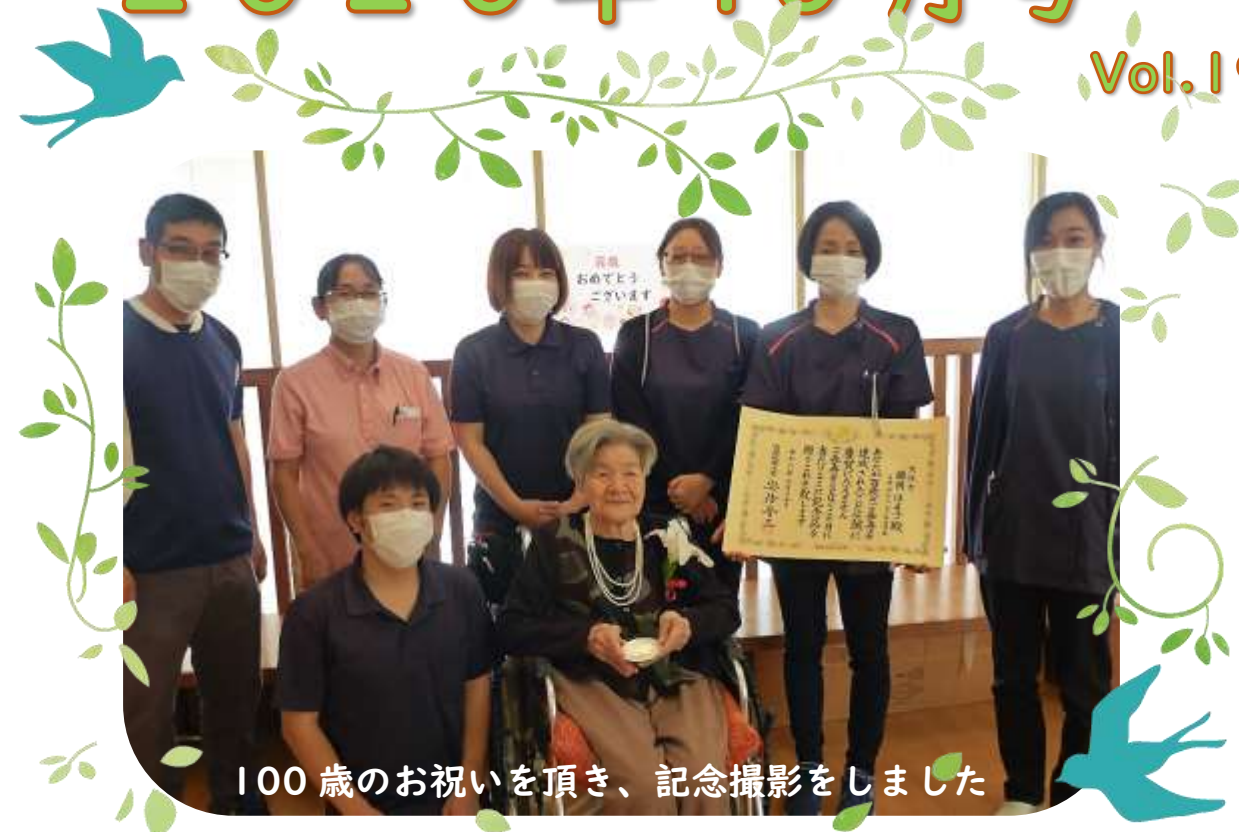
100歳のお祝いを頂き、記念撮影をしました