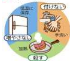
■ 食中毒予防の3原則