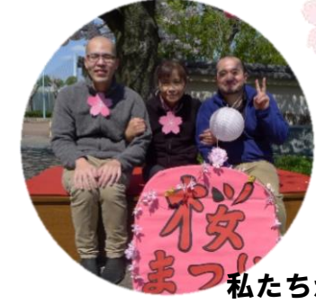
私たちが担当しました