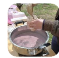
豆乳入りおしるこ