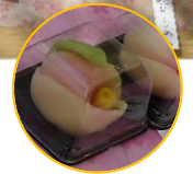
白あんで作った上生菓子