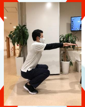
膝を曲げてしまうと膝が前に出て膝に負担がかかってしまいます