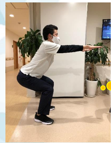
膝を曲げずにおしりを付きだすようなイメージで！