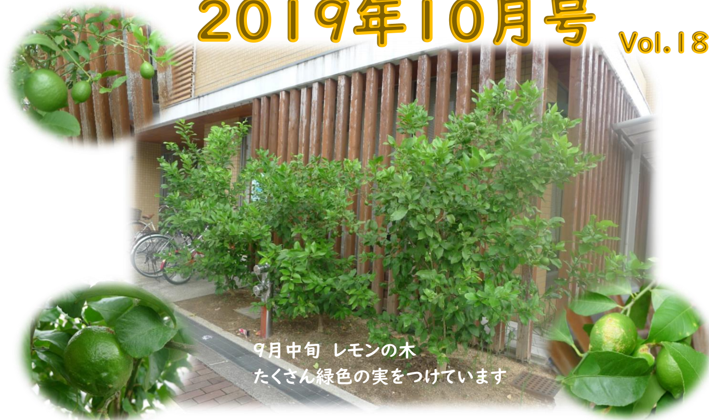
9月中旬 レモンの木 たくさん緑色の実をつけています