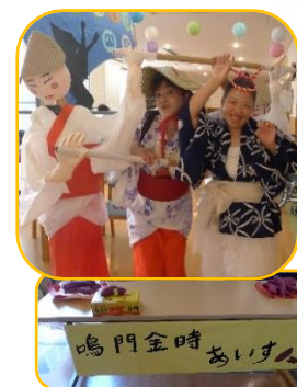
鳴門金時 アイスクリーム

各階の出店では、かき氷の上にアンコとバニラアイスのをせた沖縄ぜんざい。すだちを使った冷やしだちうどんと鳴門金時のアイスクリーム。甘〜く煮たりんごを使ったアップルパイにわんこそばをご用意しました。「おいしいわ〜」「これ、好きやからお替りできる?」「お腹いっぱい、もう食べられへんわ〜」等の嬉しいお言葉と、笑顔いっぱいの記念撮影。とても楽しい夏祭りの1日でした。