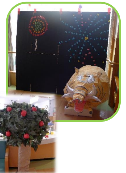
夏祭り実行委員の手作り作品