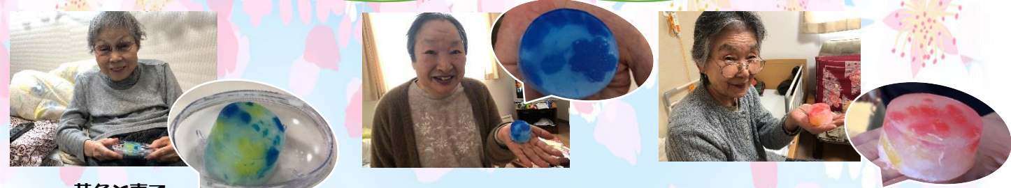
黄色と青で 涼しげな石鹸！ ローズの香りです