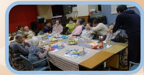
★クリスマスメニューで、笑顔いっぱいの居酒屋です。