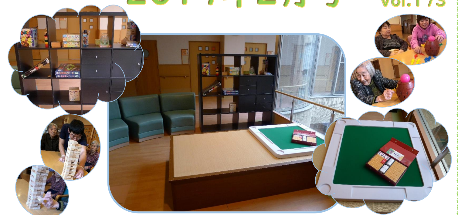
4階、南食堂側にレクリエーションコーナーができました！