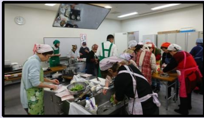
旭区高齢者の生きがいと健康づくり推進事業