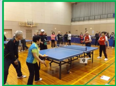
旭区高齢者の生きがいと健康づくり推進事業