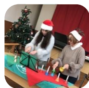
1階交流スペースにて クリスマスコンサート♪