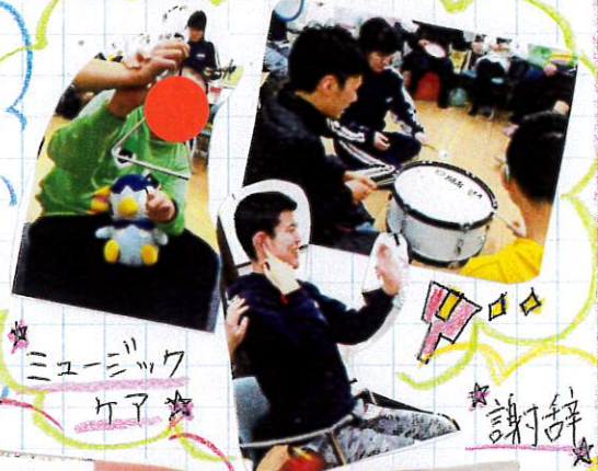
★ ミュージックケア ★