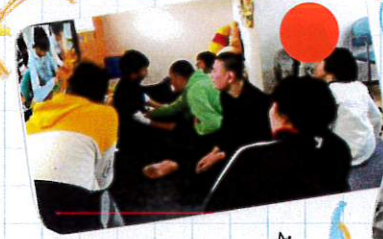
★ スライドショー ★