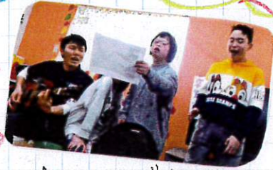
★ みんなで合唱 ★