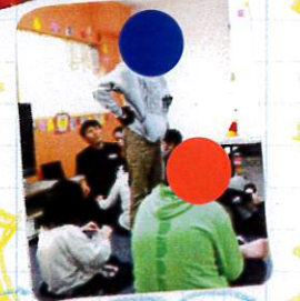
★ おやつ作り ★