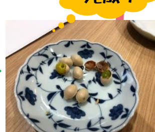
花壇に落ちている物を拾っ てきました～☆