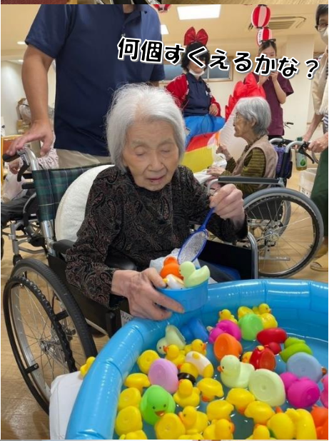
何個すくえるかな？