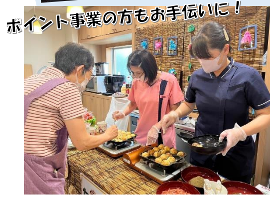
ポイント事業の方もお手伝いに！