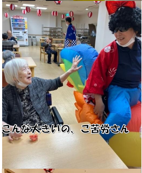
こんな大きいの、ご苦労さん